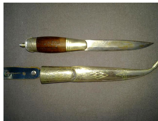
Knivtillverkning är ett hantverk som många resande arbetat med.

Påfallande många inom Resandefolket ägnar sig också åt konstnärliga yrken. Även om det inte är en huvudsyssla, är många författare, konstnärer, musiker, sångare, skådespelare och liknande. Naturligtvis återfinns Resandefolket inom alla yrken, men detta kan tolkas som att Resandefolket föredrar fria och kreativa yrken.