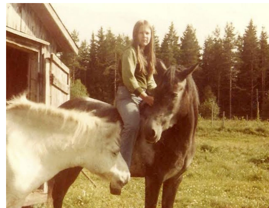
Suss till häst.

Hästintresset som jag hade odlat som liten växte sig starkare ju äldre jag blev. Det började med att jag fick en häst som stod hemma hos mina farföräldrar. Som barn passade jag på att få rida eller åka med travhästarna hemma hos olika släktingar. Jag hade tur med att så många av mina släktingar hade hästar under min uppväxt. Detta ledde även till att jag skaffade mig en utbildning som ridlärare. Som mest hemma hade vi 12 egna hästar och några inackorderade.