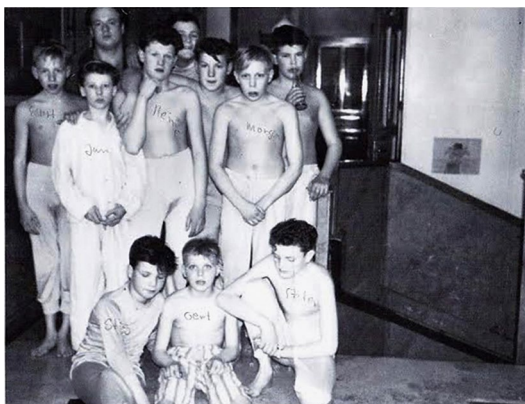
En grupp pojkar på Skärsbo pojkhem.

Inte visste jag då vad det var för något. Senare förstod jag att det var en »tattare« han menade.