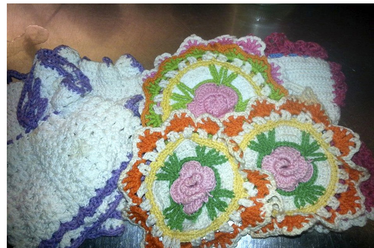
Grytlappar.