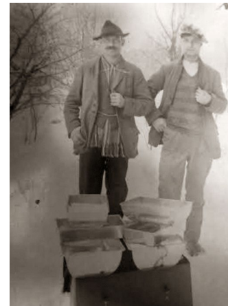
Försäljare med plåtformor till försäljning. Foto i privat ägo.

Det finns berättelser om hur »tattarna« gick på skogen och tjuvsköt. Räv- och ekorrskinn gav bra betalt. På 1930-talet tjänade en yrkesman 40–50 öre i timmen. Ett ekorrskinn betingade ett pris på 2,50 och för ett rävsinn kunde man få upp till 100 kronor. Med den jämförelsen är det inte svårt att förstå att valet var enkelt. De som tjuvjagade fick sedan ingen anställning i skogen, men vad gjorde det när ett rävsinn gav så bra betalt.