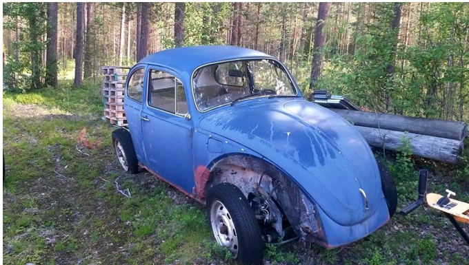
Skrothandel har haft en stor betydelse.

Skrothandel är en av de näringar som har haft stor betydelse för Resandefolket. Kee berättar om hur det var att växa upp på en skrotgård och Thomas Larsson berättar om sin morfar som var den ende i Sverige som på 1940-talet hade rättigheter att handla med skrot i utlandet.