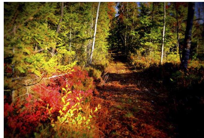
Storgatan i Krämarstan som det ser ut idag.

I Jönköping på 1940-talet ägde också en fördrivning av Resandefolket rum. Det bodde många resande vid Östra Torget i Jönköping. Det fanns rykten om att »tattarna« trakasserade kvinnor och att de levde av fattigunderstöd. Vid en utredning visade det sig att av de 450 invånare som fanns registrerade som »tattare« fick