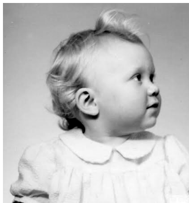
Liten Eva 1953.

Mamma och pappa fick tre barn tillsammans, mig och mina två bröder. Sedan fick mamma fyra barn med en annan man och min pappa fick ett barn med en annan kvinna. Låter väldigt strukturerat, tycker ni inte?