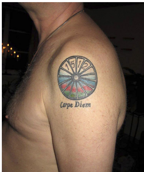
Hjulet är Resandefolkets symbol och året 1512 första gången vi säkert vet att en grupp resandelromer kom till Sverige.

gemenskap. Alltför många resande har drabbats av psykisk ohälsa, och dövat sitt självförakt och sin ångest i alkohol och droger.