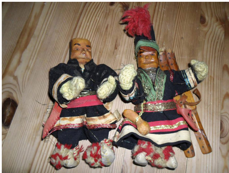
Mor Theas dockor.

Hon reste på sig ibland för att gå till skafferiet där hon förvarade snören och stumpar som hon fått när hon handlat. I en låda med olika saker hade hon lite färggranna band som hon tog med sig till bordet. Sedan började hon sy kläderna till sina dockor. Ibland hade hon inga band utan använde tyger som hon fått när hon varit ute och sålt gummorna och gubbarna, och klippte till band av dem.