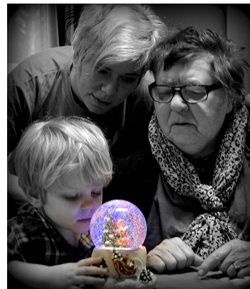
Med gammelmormor och mamma.

»När vi gick runt och tiggde mat och kläder i gårdarna så var det många som inte ville ge något till oss«, berättar mormor. »Ge inget till tattarna, ni blir bara lurade, och avstulna saker. Ibland fick vi ingen mat alls. Då var det svårt att somna«, berättar mormor.