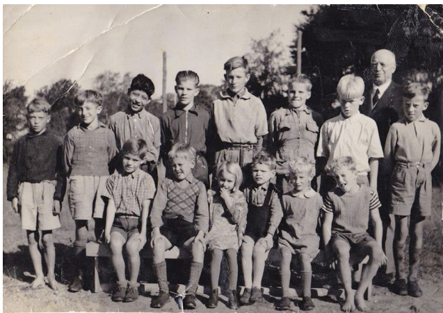
Barngrupp på Wockatz barnhem.

I Kragenäs började jag skolan, på barnhemmets egen skola. Där var en ung fröken som gillade barn och jag trivdes med henne. Tyvärr kommer jag inte ihåg vad hon hette. Det var i första klass och att bli väl behandlad var nytt för mig. Hon kramade barnen. Vi var kära i henne som barn blir i en snäll människa.